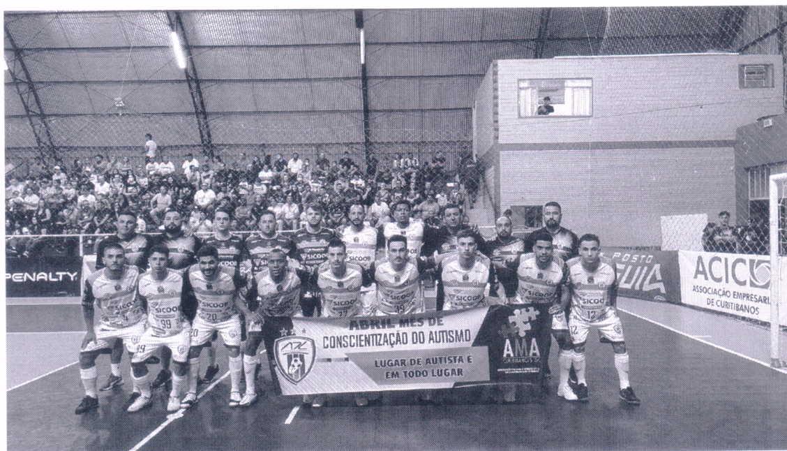
29/03/2022 – Campeonato Catarinense Série Ouro 2022 Campanha de Conscientização do Autismo – Curitibaanos