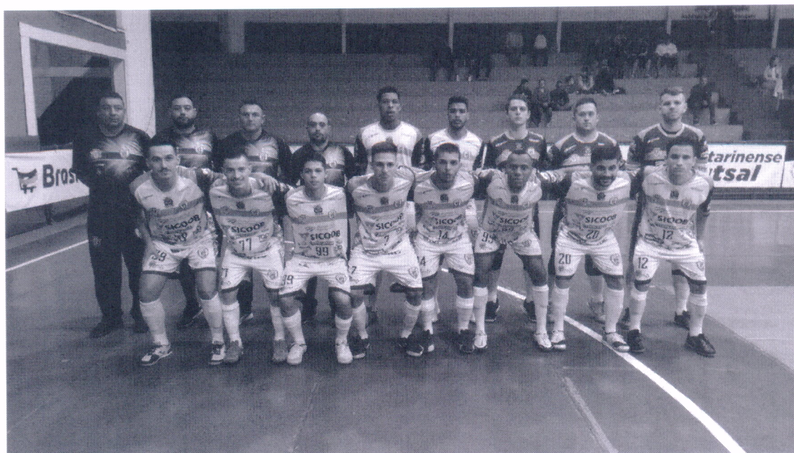
14/04/2022 – Campeonato Catarinense Série Ouro 2022 Florianópolis