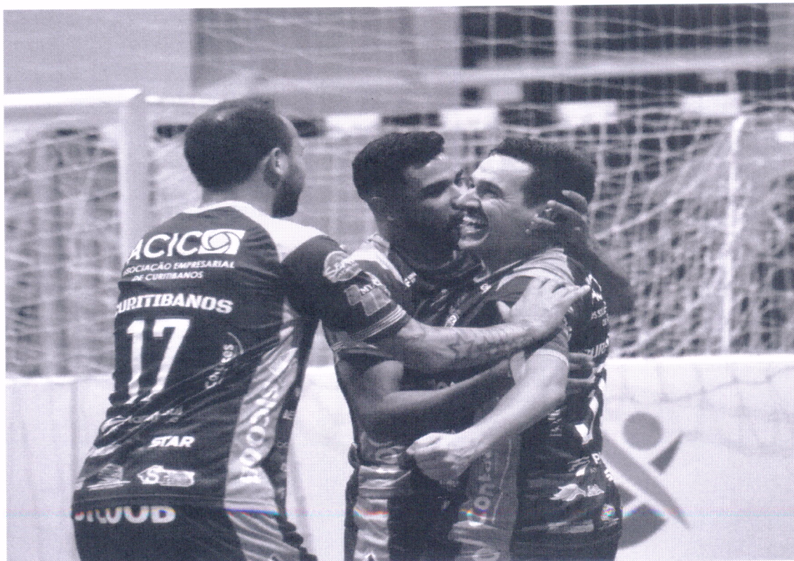
18/05/2022 – Campeonato Catarinense Série Ouro 2022 Joaçaba