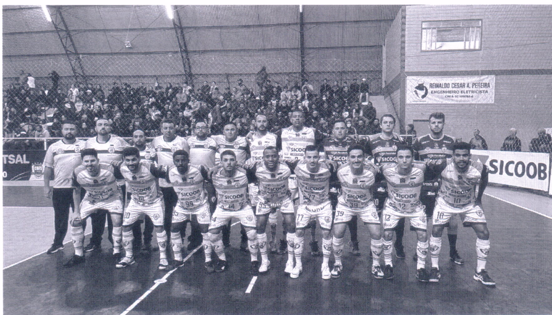
08/06/2022 – Campeonato Catarinense Série Ouro 2022 Curitibanos

ASSOCIAÇÃO DESPORTIVA CURITIBANOS 12 DE DEZEMBRO DE 2006