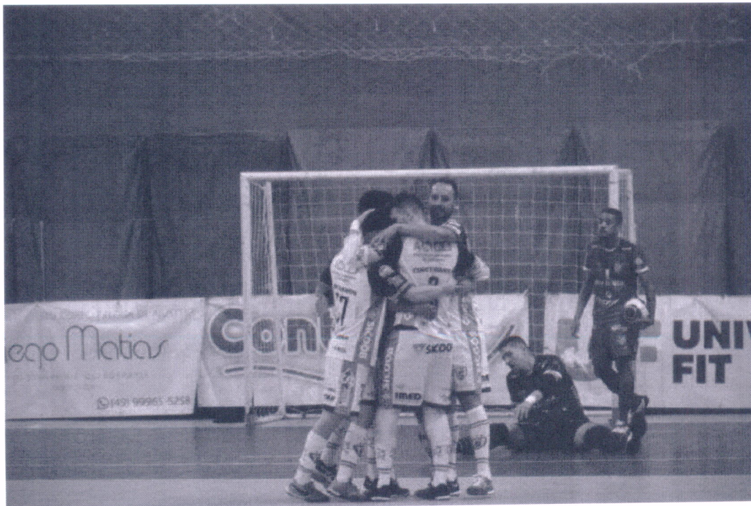
Jogadores da ADC Curitibanos comemoram gol em partida contra o Futsal São Lourenço

Após o deslize frente ao Joaçaba Futsal na quarta rodada do estadual, a ADC Curitibanos Futsal fez valer o fator casa e se recuperou ao vencer por 5 a 2 o Futsal São Lourenço na última sexta-feira (27) pela quinta rodada do Campeonato Catarinense de Futsal, Série Ouro.