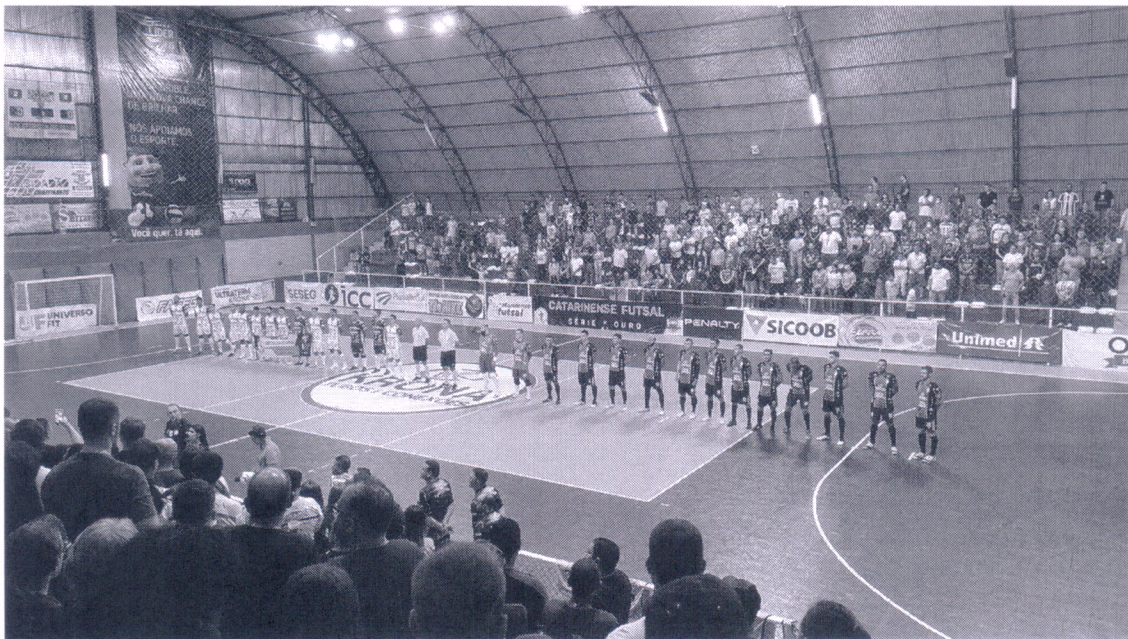
29/03/2022 – Campeonato Catarinense Série Ouro 2022 Campanha de Conscientização do Autismo - Curitibaanos