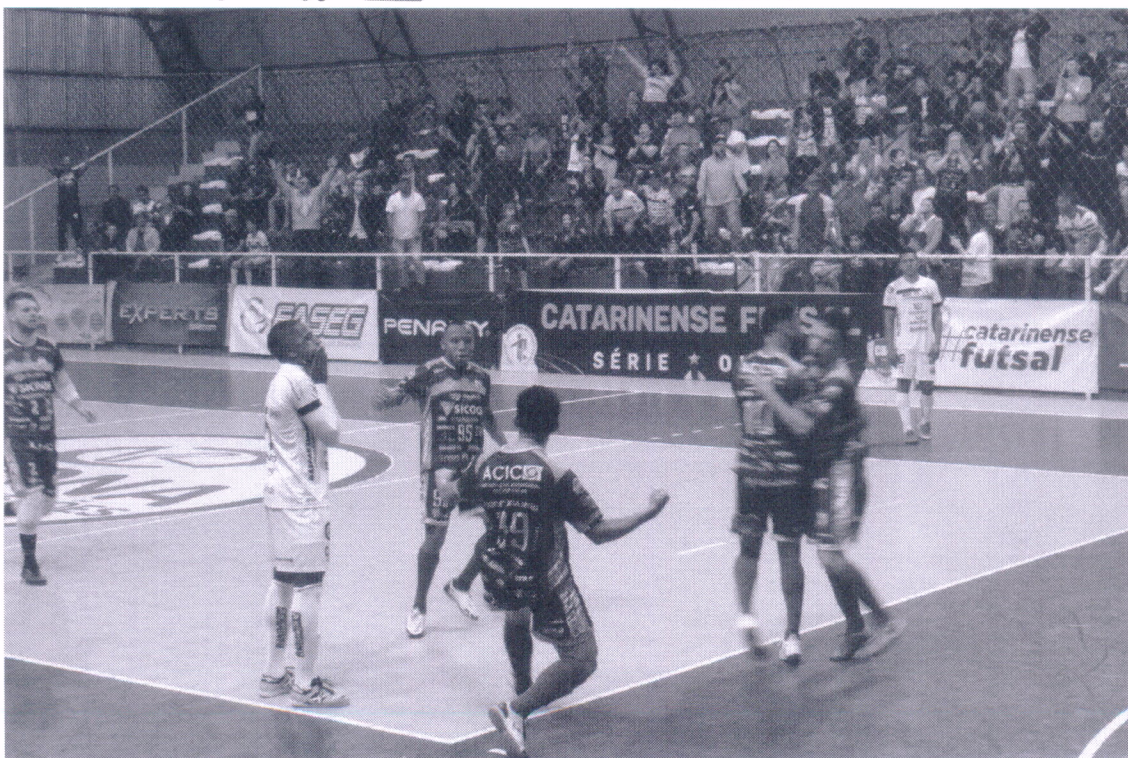
26/04/2022 – Campeonato Catarinense Série Ouro 2022 Curitibanos