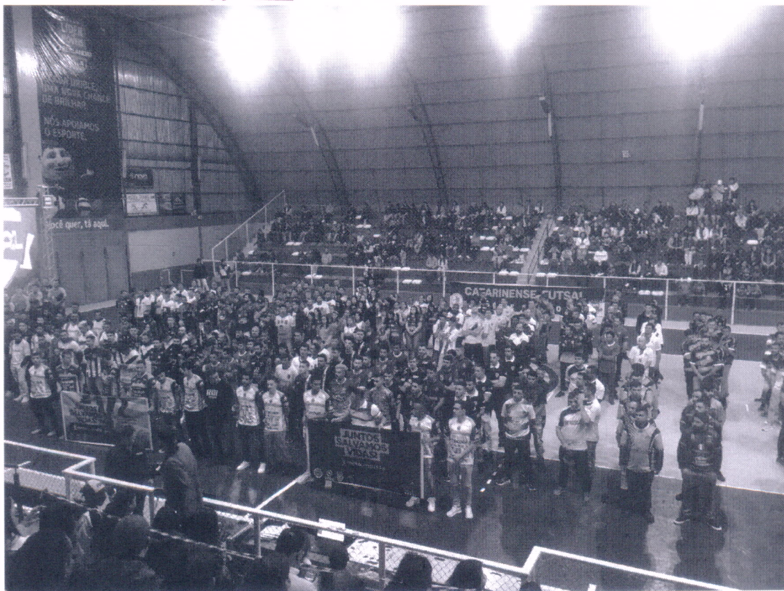
14/05/2022 – Campeonato de Futsal Indústria e Comércio Campanha Maio Amarelo - Curitiba