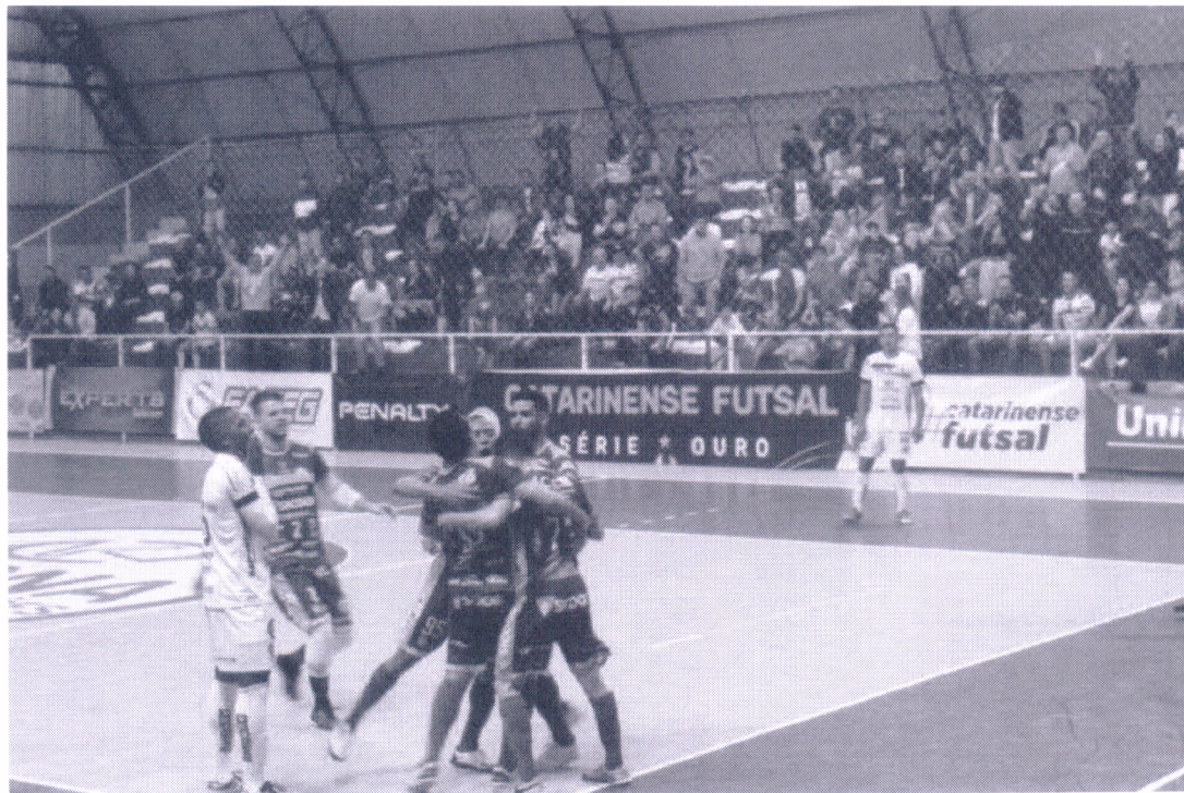
Jogadores da ADC comemoram gol