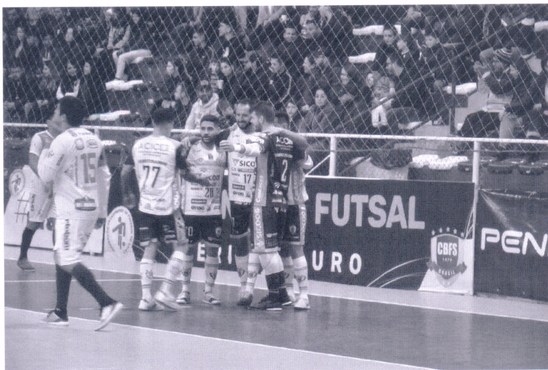
14/06/2022 – Copa Santa Catarina 2022 Curitibanos