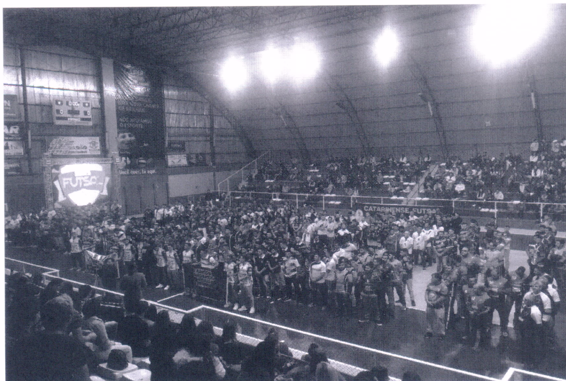
14/05/2022 – Campeonato de Futsal Indústria e Comércio Campanha Maio Amarelo - Curitibanos