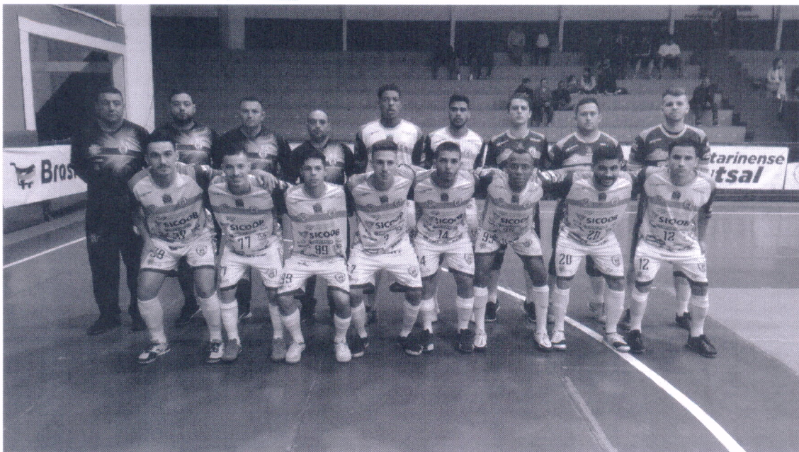
14/04/2022 – Campeonato Catarinense Série Ouro 2022 Florianópolis