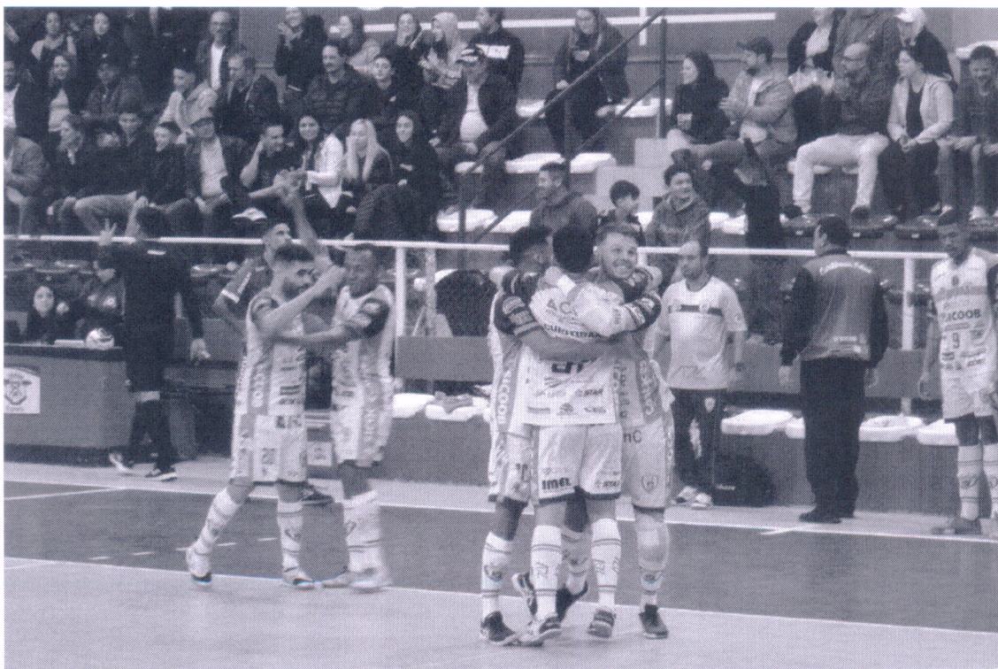
27/05/2022 – Campeonato Catarinense Série Ouro 2022 Curitibanos